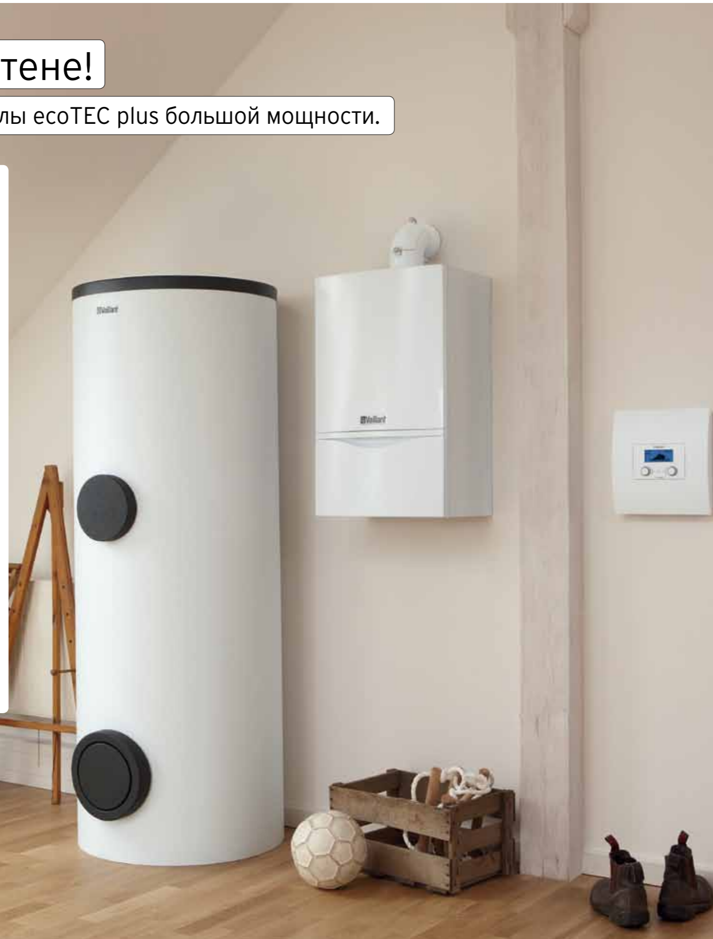
Котёл ecoTEC plus, водонагреватель uniSTOR, устройство регулирования calorMATIC 630/2

* Если иного не требуют местные нормы и правила ** Вычисляется по низшей теплоте сгорания топлива