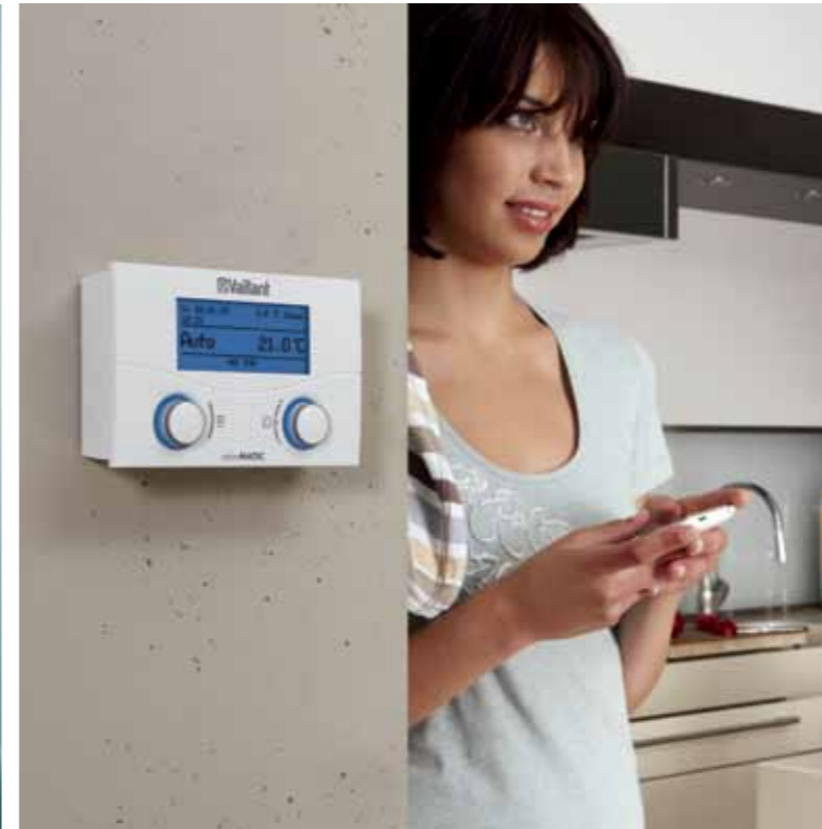
Устройство регулирования calorMATIC 430