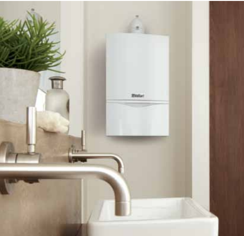
Котёл ecoTEC plus

Конденсационные котлы ecoTEC plus мощностью до 37 кВт.