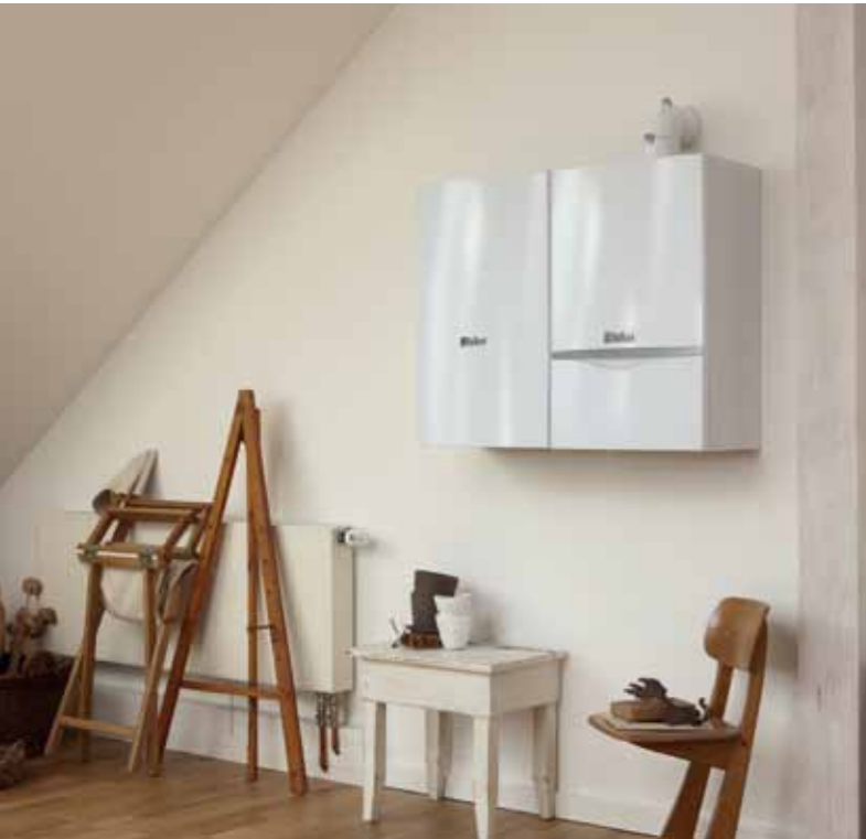
Котёл turboTEC plus и настенный водонагреватель VIH CK 70