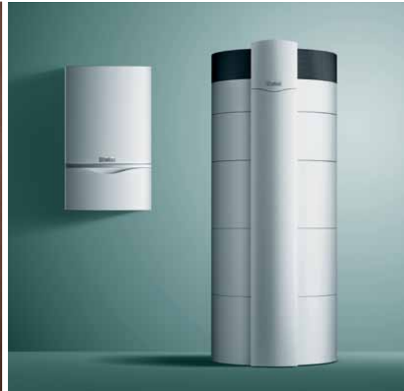
Котёл ecoTEC plus и водонагреватель actoSTOR